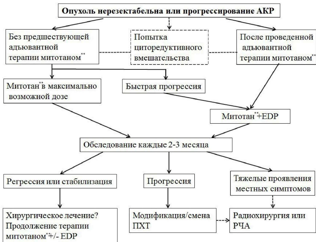
Рисунок 2. Алгоритм лечения при нерезектабельном или прогрессирующем АКР