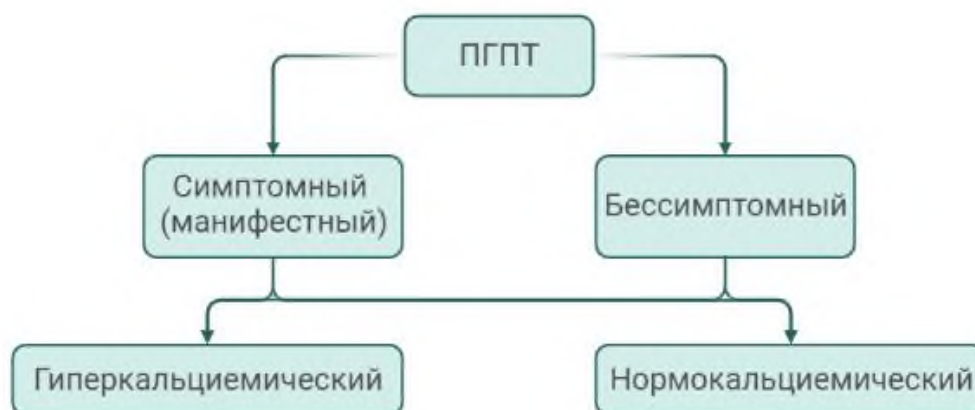
Рис. 1 Классификация ПГПТ

Наиболее часто диагностируется гиперкальциемический вариант ПГПТ , характеризующийся повышением уровня кальция сыворотки крови в сочетании с повышенным (редко высоко-нормальным) уровнем ПТГ. Однако ПГПТ не всегда сопровождается повышением уровня кальция крови выше верхней границы референсного диапазона. Нормокальциемия может быть транзиторной при гиперкальциемическом варианте и стойкой при нормокальциемическом варианте заболевания. Нормокальциемический вариант ПГПТ (нПГПТ) характеризуется неизменно верхненормальным уровнем общего и ионизированного кальция в сыворотке крови в сочетании со стойким повышением уровня ПТГ, в отсутствии очевидных причин вторичного гиперпаратиреоза (дефицит витамина D, патология печени и почек, синдром мальабсорбции, гиперкальциурии и др.)[11, 17]. Классификация ПГПТ представлена на рис.1.